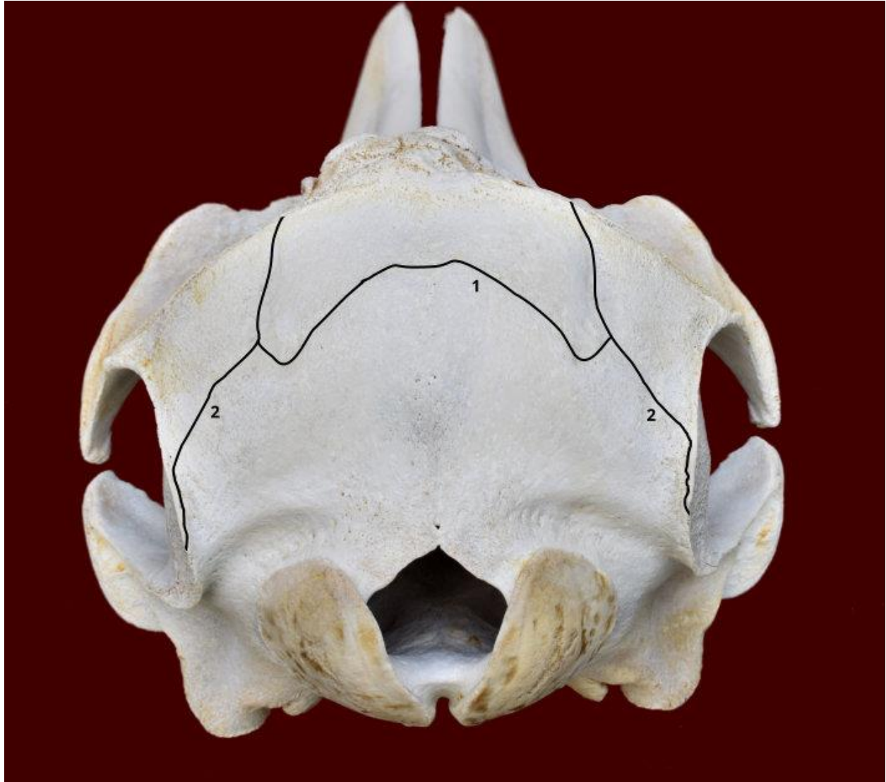
Slika 1. Lubanja dobrog dupina iz Jadranskog mora - norma caudalis. Označeni su sljedeći šavovi: sutura occipitointerparietalis (1) i sutura lambdoidea (2).

Usljed odstupanja od položaja kostiju glave, koji je uobičajen za većinu domaćih i ostalih kopnenih sisavaca, u dobrog dupina uočene su znate razlike u položaju šavova lubanje. Položaj šavova na lubanji dobrog dupina nije dosada opisan te su u okviru ovog istraživanja izrađene fotografije lubanja i ucrtani determinirani šavovi (slika 1, 2, 3 i 4)