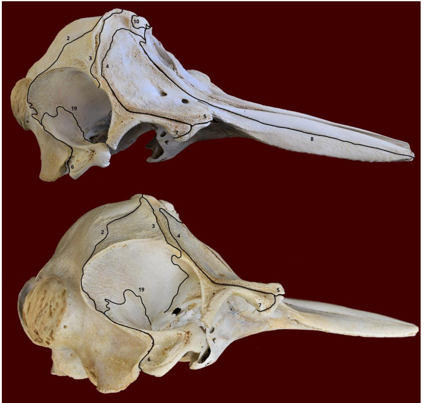
Slika 3. Lubanja dobrog dupina iz Jadranskog mora - norma lateralis (gore i dolje). Označeni su sljedeći šavovi: sutura lambdoidea (2), sutura coronalis (3), sutura frontomaxillaris (4), sutura lacrimomaxillaris (5), sutura occipitosquamosa (6), sutura frontolacrimalis (7), sutura maxilloincisiva (8), sutura frontonasalis (10) i sutura squamosa (19).