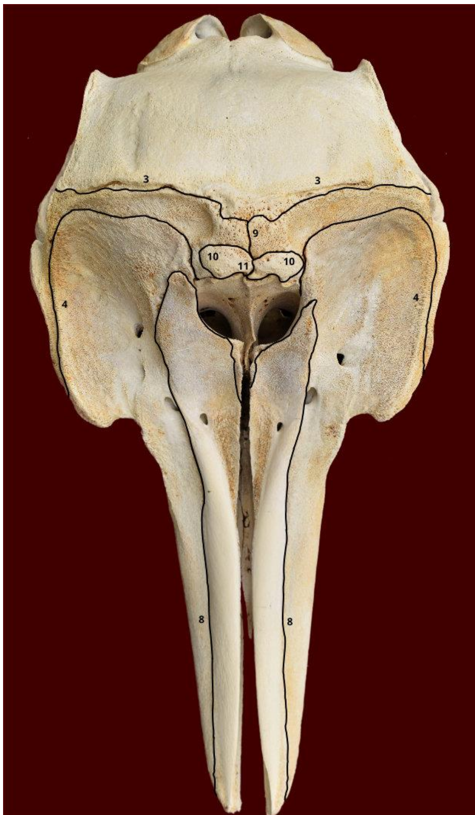
Slika 2. Lubanja dobrog dupina iz Jadranskog mora - norma dorsalis. Označeni su sljedeći šavovi: sutura coronalis (3), sutura frontomaxillaris (4), sutura maxilloincisiva (8), sutura interfrontalis (9), sutura frontonasalis (10) i sutura internasalis (11).